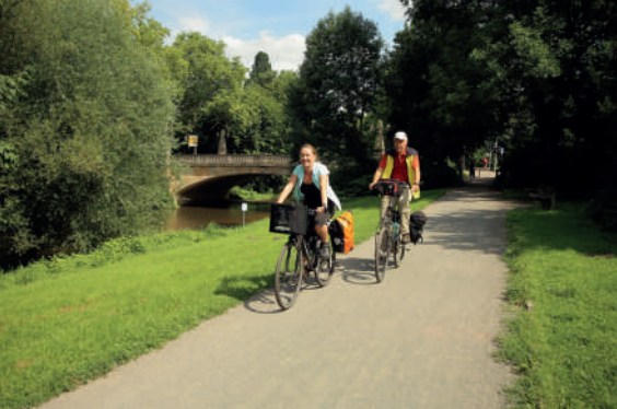
Gera-Radweg in Erfurt