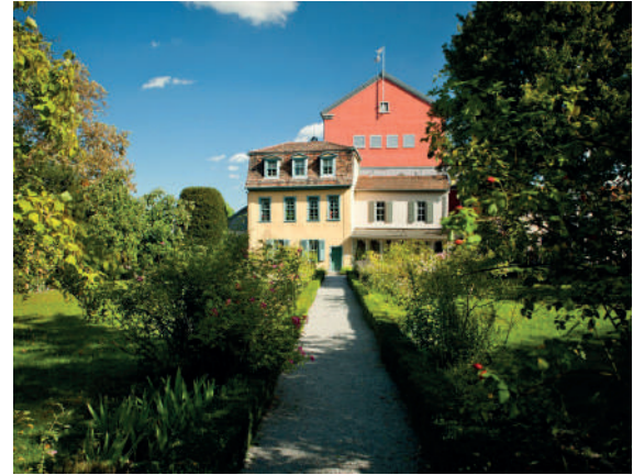
Schillers Gartenhaus, Jena