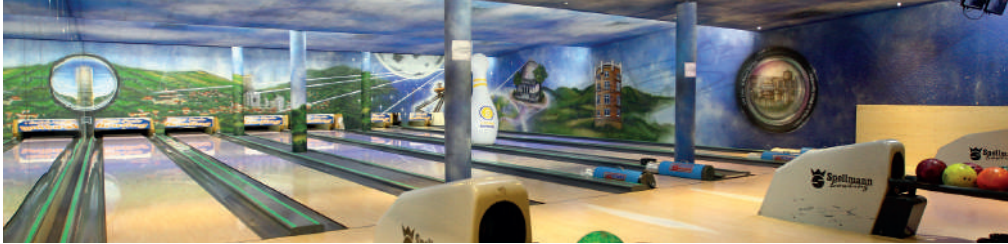
Bowlingbahn im Fair Resort

Rudolstädter Straße 93, 07745 Jena Tel.: 03641 6850 info@jembo.de www.jembo.de