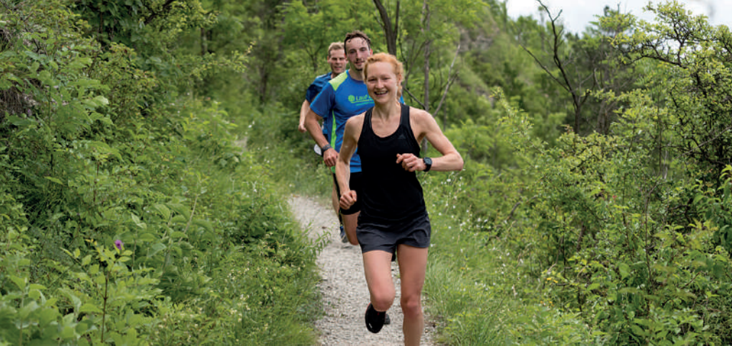
Trailrunning in den Kernbergen