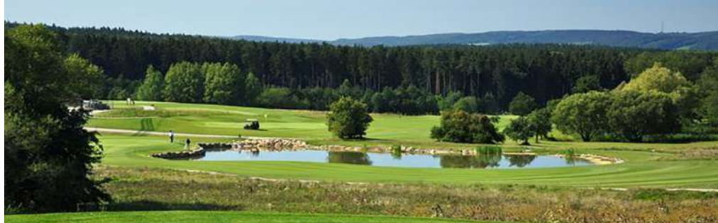
GolfResort Weimarer Land