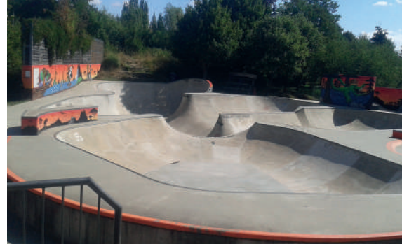
Skatepark Red Shelter

Stauffenbergstraße 20A, 99427 Weimar Tel.: (Jugendclub): 03643 420873 jc-nordlicht@t-online.de