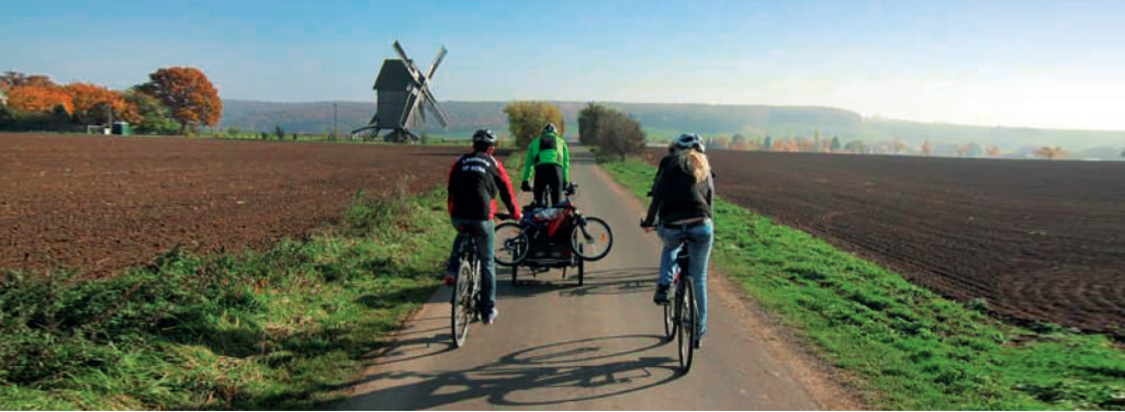
Bockwindmühle bei Krippendorf